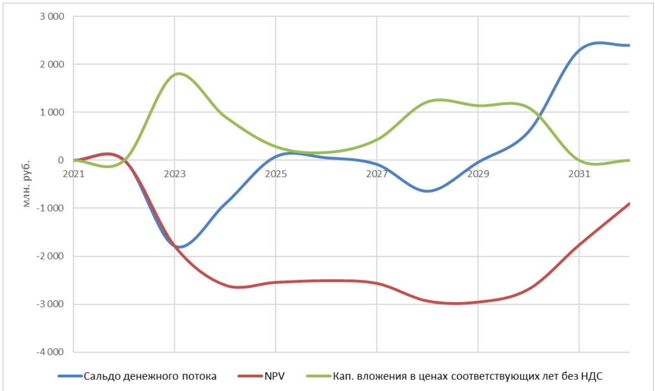
Рисунок 4.1 - Результаты оценки эффективности полного состава проектов в зоне АО «Теплоэнерго»